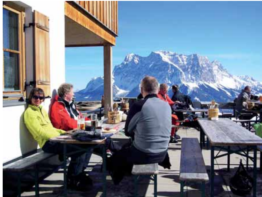
Unsere Skiroulette-Gruppe genießt Sonne und Ausblick in der wohlverdienten Pause.