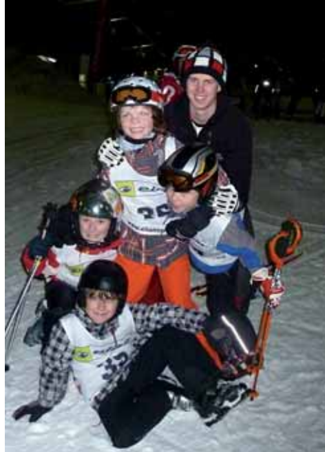
Vier Kinder beim Nachwuchs-Cup in Bottrop am Start