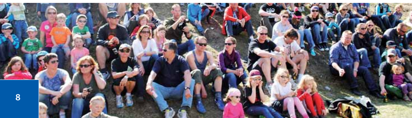
Snowsails Skilehrerin mit Kindern

Die Siegerehrung wurde zum späten Nachmittag auf dem Sportplatz in Grimentz zelebriert. Auch hier wurden die Teilnehmerinnen und Teilnehmer noch einmal von der Familie, von Freunden und natürlich von ihren Skilehrerinnen und Skilehrern bejubelt und beglückwünscht. Urkunden, Pokale, Medaillen und einige Leckereien hatten sich alle mehr als verdient.