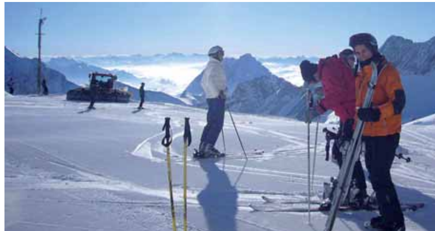
Skiroulette auf der Zugspitze