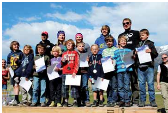
Siegerehrung des Kinderrennens