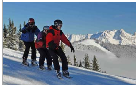
SPORTREISEN-SPEZIAL: Alle Reisen des Winters 2008/2009