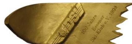
100 Jahre Essener Skiklub – Ehrung auf dem Verbandstag