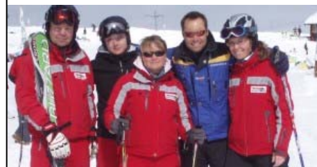
Alpine gehen mit der Zeit – Aus- und Fortbildung hoch im Kurs