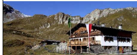
Bericht von der diesjährigen Gourmetwanderung